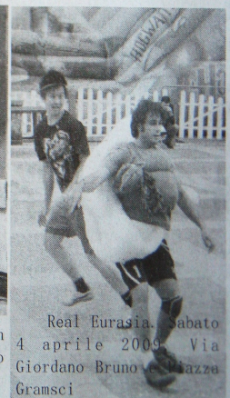
Real Eurasia. Sabato 4 aprile 2009, Via Giordano Bruno, Piazza Gramsci